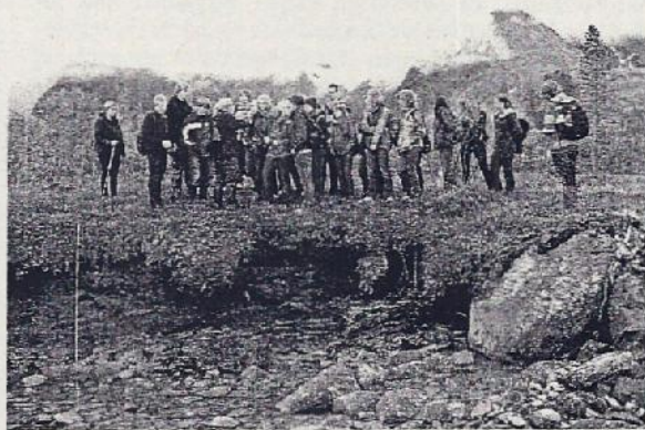
Abb 2: Auf einer etwa 2 m mächtigen Torfschicht am Sørleangsbøtn: Prof. D. Thannheiser erläutert Fakten zu den Mooren in der Region Troms.

In der weiteren Umgebung von Tromsø kommen wegen des steilen Reliefs und des starken Niederschlags ombrosoligene Hangmoore vor, die besonders am unteren Ende des Moores unter Mineralbodenwassereinfluss stehen. Die Torf-Bildung und -Ablagerung wird durch die Grundwasserzufuhr beeinflusst. Man kann diese Moortypen als Übergangsmoore bezeichnen, in denen das Torfmoos-Wachstum stark reduziert ist. In der küstenferneren Umgebung von Tromsø werden Strangmoore, sogenannte Aapamoore, angetroffen, die sich durch einen deutlichen Reliefwechsel zwischen trockenen Strängen und nassen Schlenken auszeichnen. Niedermoores sind z.B. auf der Tromsø-Insel in einer Endmoränenlandschaft