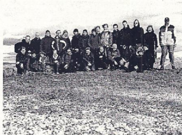
Abb 1: Die Gruppe aus Dortmund und Werl auf der Arktisch-alpinen Windheide an der Nordflanke des Storsteinen oberhalb von Tromsø.

Fünf der Pflanzenarten wurden im September 2011 erneut gefunden; für eine sechste Art wurde klar, dass 2008 eine Fehlbestimmung erfolgt war. Nun erfolgte die Beprobung der Standorte mit einem Pürckhauer-Erdbohrstock. Eine erste Bewertung der Bodenprofile nach dem Augenschein ließ bereits erkennen, dass keine kleinräumig unterschiedliche Bodenbeschaffenheit die Ursache für die Ausreißer sein konnte. Der Boden der Strandwiese wies ein einfaches Profil auf. Unter der Pflanzendecke fand sich in der Nähe zum