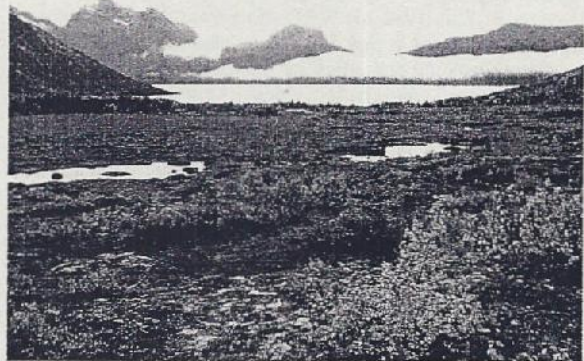
Abb 3: Blick auf das untersuchte Moor am Lyfjord, das nach der jüngsten Eiszeit auf einer isostatisch gehobenen Strandterrasse entstanden ist.

Die Entstehung der beobachteten Hügelformen lässt sich zumeist anhand einer Grabung klären, die Einblick in den