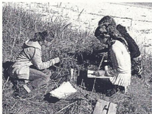
Abb. 2: Eine Arbeitsgruppe bei der pflanzensoziologischen Aufnahme am Strand von Sommarøy.

Grundgestein als Folge ehemaliger Gletschertätigkeit Lehme abgelagert worden, so können sie eben mit der allmählichen Landhebung, die in der Region Tromsø im Millimeterbereich pro Jahr liegt, wieder aufgetaucht sein und nun kleinräumig in Strandnähe mitbestimmend werden. Erstaunlich daran ist die Tatsache, dass sich die festgestellte Zonierung unter anderem auch auf den Klimawandel zurückführen lässt, nur eben den, der sich vor mehr als 10.000 Jahren abgespielt hat und mit seinen Folgen heute noch nachwirkt.