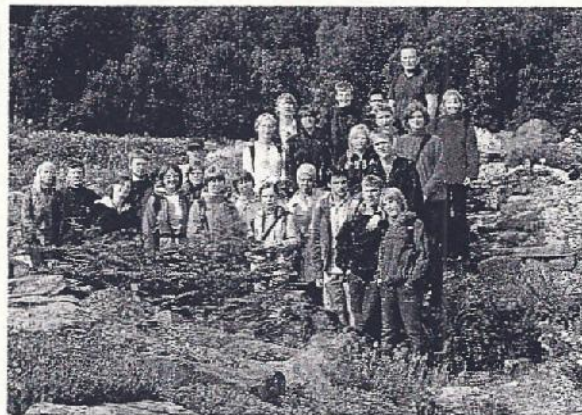
Abb. 1: Die Schülergruppe aus Werl und Dortmund im botanischen Garten Tromsø, dem nördlichsten botanischen Garten der Welt. Im Vordergrund eine Südbuche, Nothofagus sp.

Die beobachtete Zonierung an diesem Strand wird jedoch wahrscheinlich nicht nur durch die Wasserbewegung, den Wind und den damit verbundenen Sandtransport hervorgerufen. Von großer Bedeutung für die festgestellte Zonierung am Strand von Sommarøy, die auch als Stadien der Sukzession verstanden werden kann, wird die isostatische Ausgleichbewegung sein. Ausreißer bei den Pflanzenbestimmungen, die auf Lehm im Boden hinweisen, erscheinen zunächst unverständlich. Sind jedoch im Untergrund und in Vertiefungen im